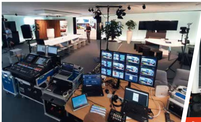
Professionelles Live-Streaming mit moderner Ton-, Kamera-, Licht- und Streaming-Technik bei der AV-Solution Partner Roadshow.

In den vergangenen Jahren haben unsere Experten der Medientechnik bei zahlreichen namhaften Kunden modernste audiovisuelle Lösungen installiert sowie unsere Veranstaltungstechniker Events und Großveranstaltungen technisch in Szene gesetzt. Hier nur eine kleine Auswahl an Projekten, die wir an dieser Stelle mit Ihnen teilen möchten.