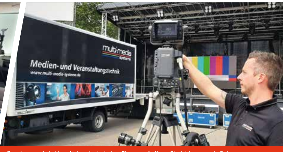
Renaissance Autokino: Neben technischer Planung, Aufbau, Einrichtung sowie Betreuung des Autokinos setzt das Kammertheater auch bei dortigen Events bei der Live-Übertragung mit mehreren Kameras auf die multi-media systems AG.