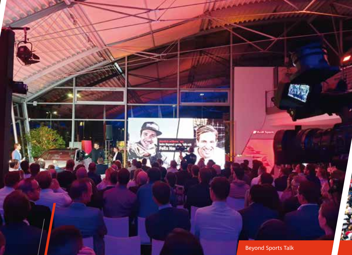
Beyond Sports Talk